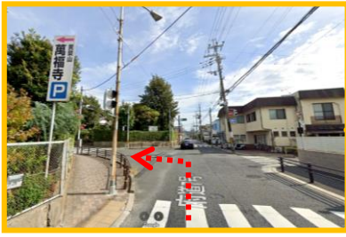
黄檗公園プールの角を右折